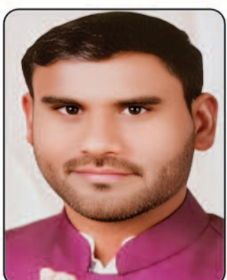
परदेशी सोनकर सभापति नगर पालिका सिमगा

प्रत्येक बच्चे के पास उत्प्रेरणा, शिक्षा, खेल - कूद मनोरंजन और क्रियाकलापों के माध्यम से शारीरिक, मानसिक और संवेदनात्मक विकास का अधिकार है, उसी को देखते हुए हरिभूमि ने बच्चों के लिए बाल भूमि परिशिष्ट प्रकाशित किया जिससे बच्चों के सर्वांगीण विकास हो सकें।